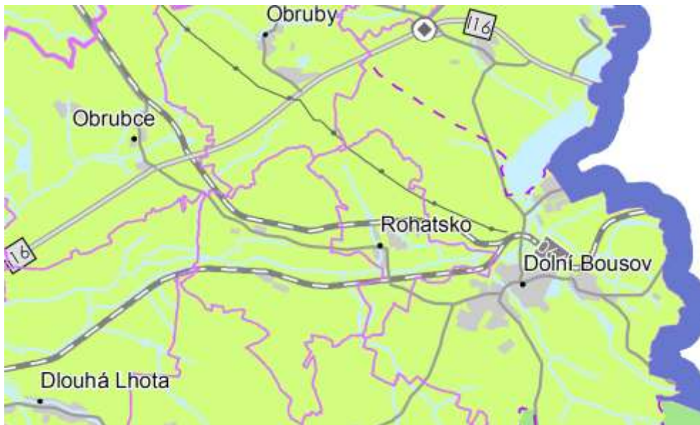
Obr.: výřez výkresu A.3: Výkres krajiny, pro které se stanovují cílové kvality

(206) ZÚR stanovují tyto společné zásady: