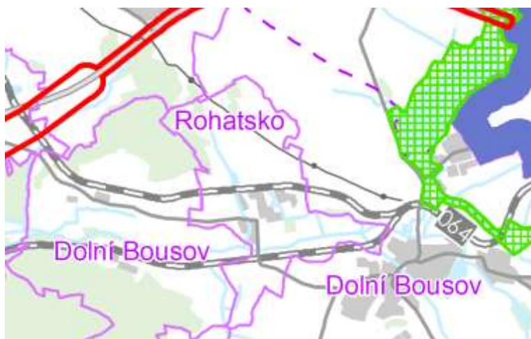
Obr: výřez výkresu č. A.2: Plochy a koridory, včetně ÚSES

Řešené území není dotčeno koridory nadmístního významu.