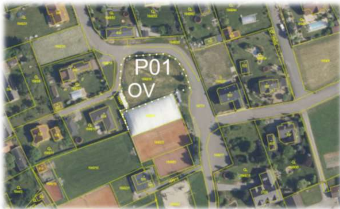
Obr.: Zobrazení plochy P01 (OV) do ortho snímku katastru nemovitostí