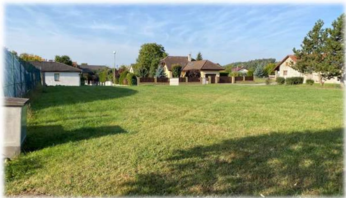
Obr.: Stávající stav plochy P01 (OV), která je předmětem změny č. 1 ÚP Rohatsko